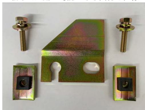
Rクリップ + NVナット