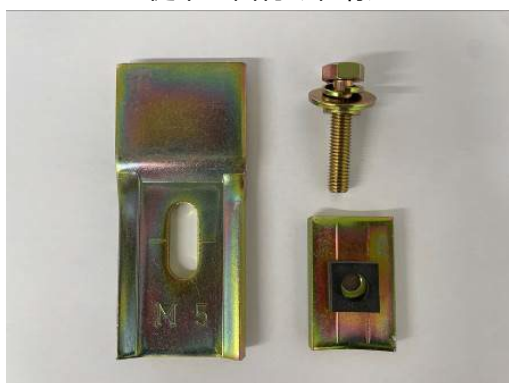
HZクリップ + NVナット